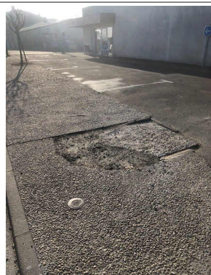
Une détérioration importante du trottoir près de la boulangerie, suite à un affaissement, a été réparée par les agents techniques pour la sécurité des usagers.