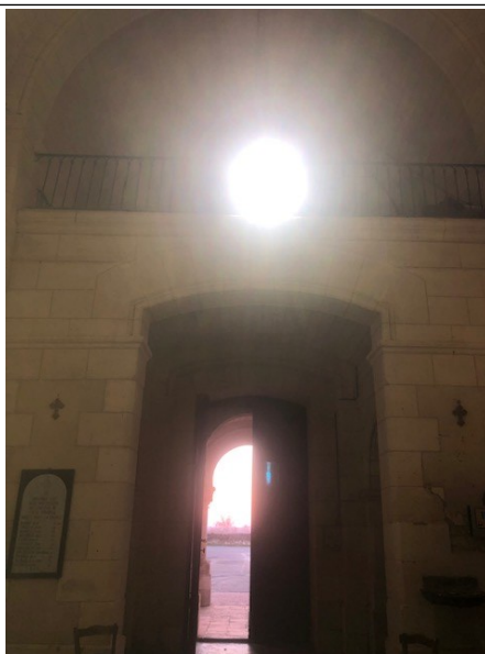
Des éclairages intérieurs de l'église Saint Pierre ont été changés dans un souci d'économie avec de nouveaux luminaires à LED.