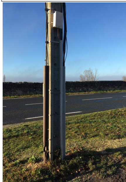
Remplacement du boîtier télécommande éclairage public au niveau de la Résidence Castanet.