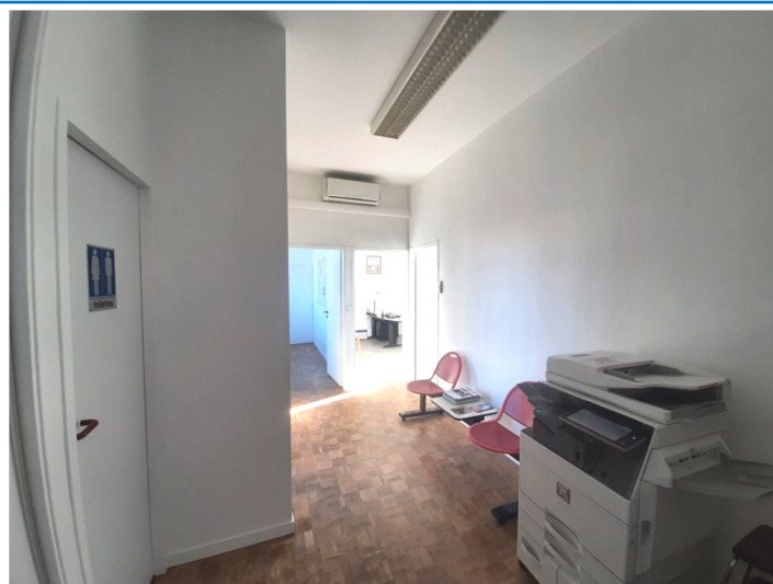
Réfection intérieure de la mairie par les agents techniques