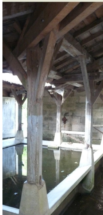
LAVOIR DE NOLLY