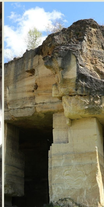
CARRIERES DE PIERRE